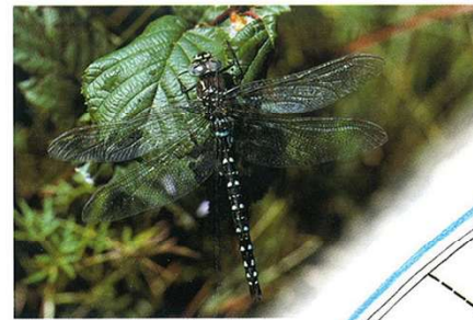
Torf-Mosaikjungfer - Aeschna dei giurci