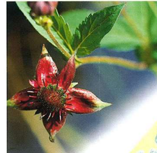
Sumpfbutterglocke Cinquefoglia delle paludi