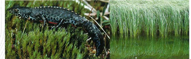
Alpenmolch - Tritone alpino