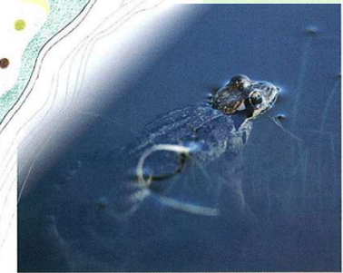
Grasfrosch - Rana montana

✳ Positione: Comune di Rasen-Anterseiva; 1050 m s.l.m. ✳ Estensione: 23 ha ✳ Origine: Il biotopo deriva dall'interamento di un antico lago sbarato da una conoide. ✳ Vegetazione: torbiera alta e di transizione, bosco ripariale e pecceta, prati umidi, vegetazione di torbiera bassa con canneto ai bordi degli specchi d'acqua. ✳ Importanza: Si tratta dei resti di un'estesa zona umida e di un habitat prezioso e molteplice per molte specie animali e vegetali minacciate. ✳ Tutela: dal 1973