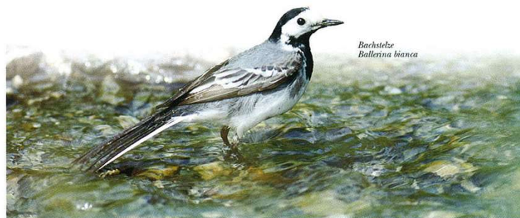
Bachstelze Ballerina bianca

↑ Im Hochmoor wächst der Sonnentau , eine fleischfressende Pflanze. Mit ihren Tentakeln, die ein klebriges Sekret ausscheiden, hält die Pflanze kleine Insekten fest, um sie an der Blattoberfläche zu verdauen. ↑ Nella torbiera alta cresce la drosera , una pianta carnivora. Con i suoi tentacoli, che secernono un liquido appiccicoso, la pianta cattura piccoli insetti, per assimilarli attraverso la superficie delle foglie.