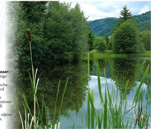
Alpenmolch - Tritone alpino

→ Die offenen Wasserflächen sind wichtige Laichgebiete für verschiedene Lurche wie Alpenmolch und Grasfrosch . → Gli stagni sono luoghi di riproduzione importanti per gli anfibi come per esempio il tritone alpino e la rana montana .