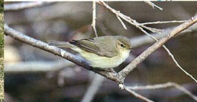
Zilpzalp - Luscinia piccola