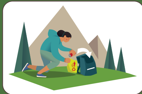
Portare a casa i rifiuti Abfall nach Hause bringen | Take the waste home