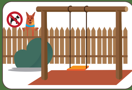
Non entrare nel parco giochi Spielplatz nicht betreten | Don't enter in playgrounds