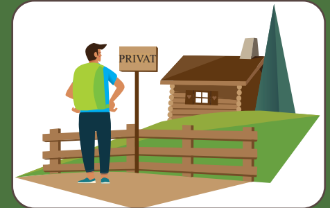
Rispettare i segnali Beschilderungen beachten | Observe signage