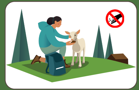
Non dare da mangiare agli animali Tiere nicht füttern | Do not feed animals