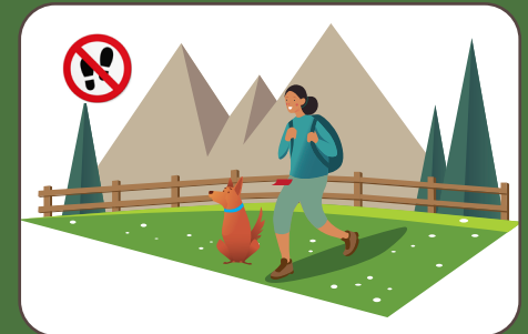
Non entrare nei prati Wiesen nicht betreten | Don't tread on meadows