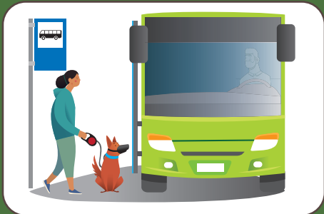
Museruola in autobus e treno Maulkorbpflicht im Bus und Zug | Muzzle in bus and train