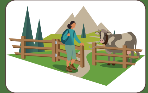
Richiudere i cancelli Zaungatter wieder schliessen | Close the gates