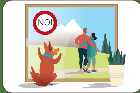
Non lasciare il cane solo Hund nicht alleine lassen | Don't leave dogs alone