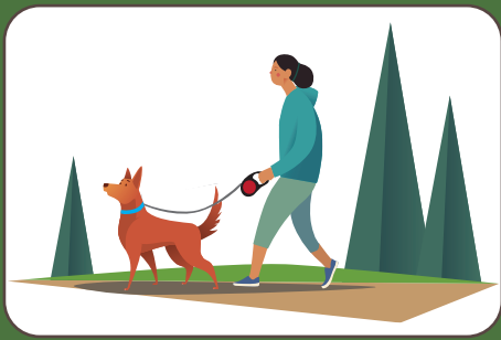
Cane al guinzaglio Hund an der Leine halten | Dog on leash