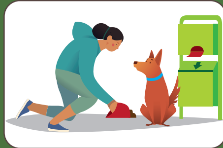
Raccogliere gli escrementi Hundekot aufsammeln | Pick up dog excrement